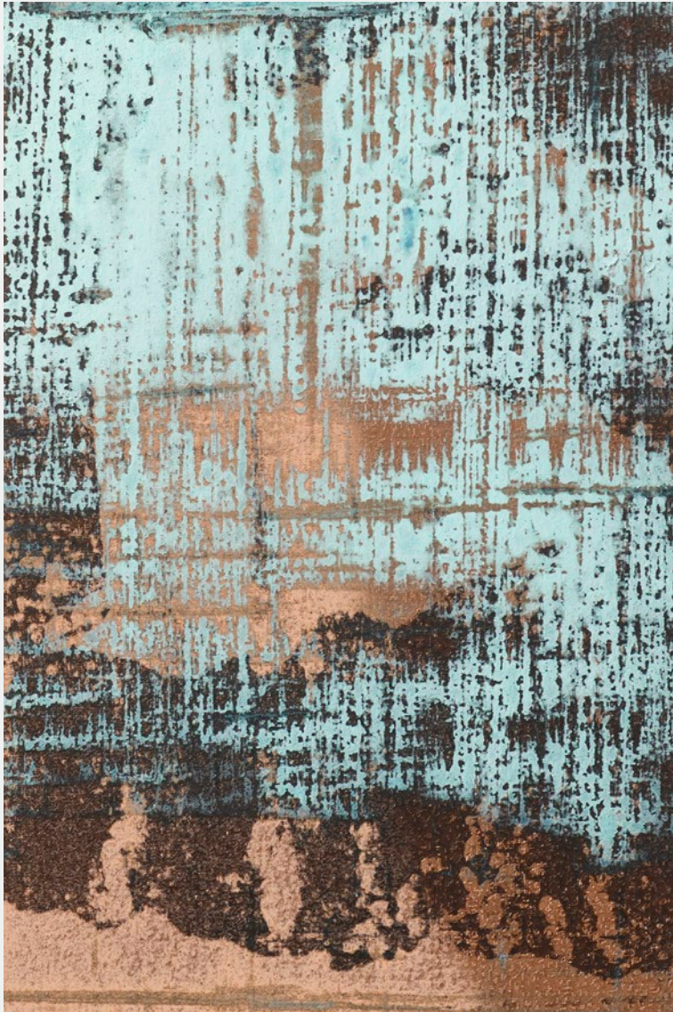
VERDERAME_WALL PAINTING FONDO BASE & 15081

The ancient structures of old cities with the beauty of copper and its vibrant oxidation.