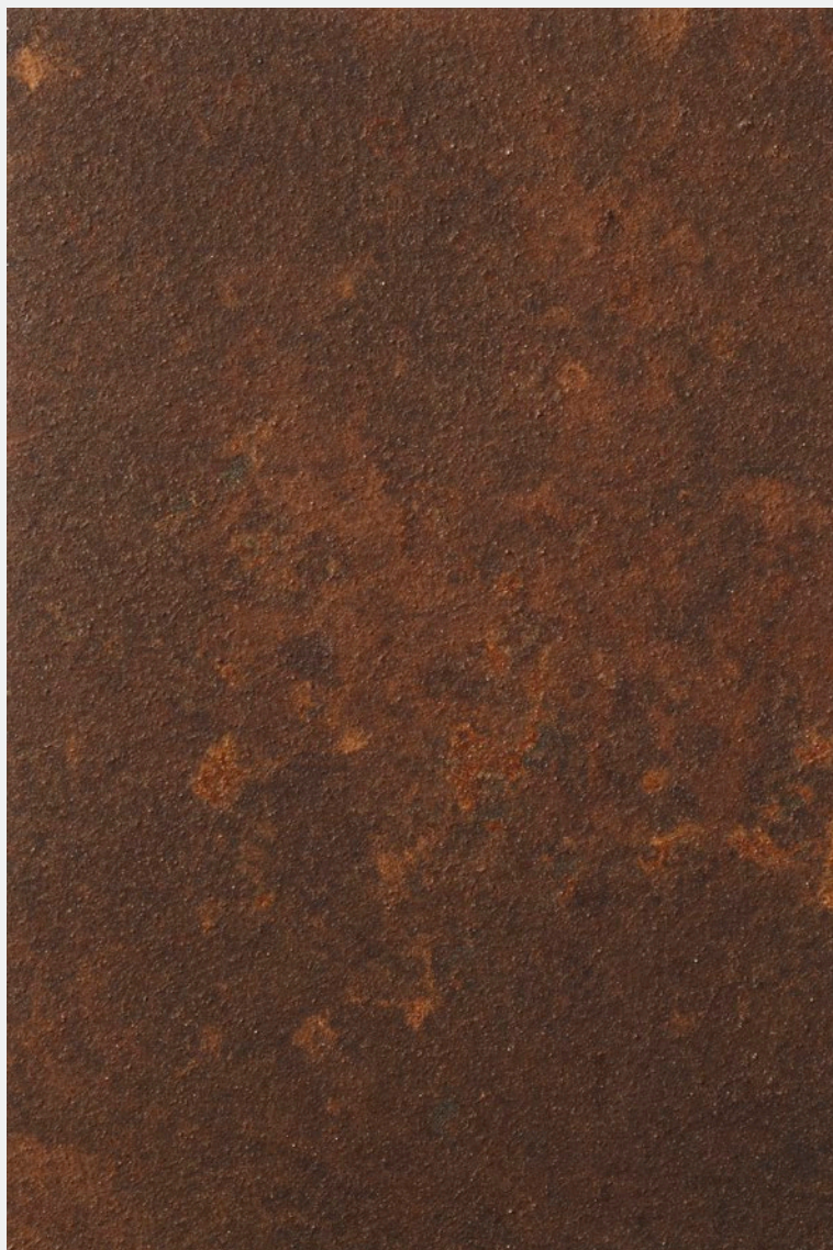
IRONic & 2SCREEN

Rust never stops and the oxidation effect of IRONic is a perfect balance between metal and fire.