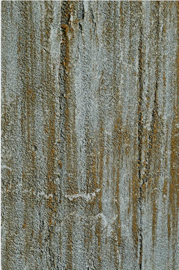
CONCRETE BY NOVACOLOR 17008 & IRONIC & FASE SILOSSANICA 6101

A concrete coating becomes even more warm and precious thanks to the oxidation of IRONic.